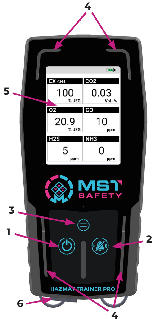
Abb. 2 - HTP-Grundgerät